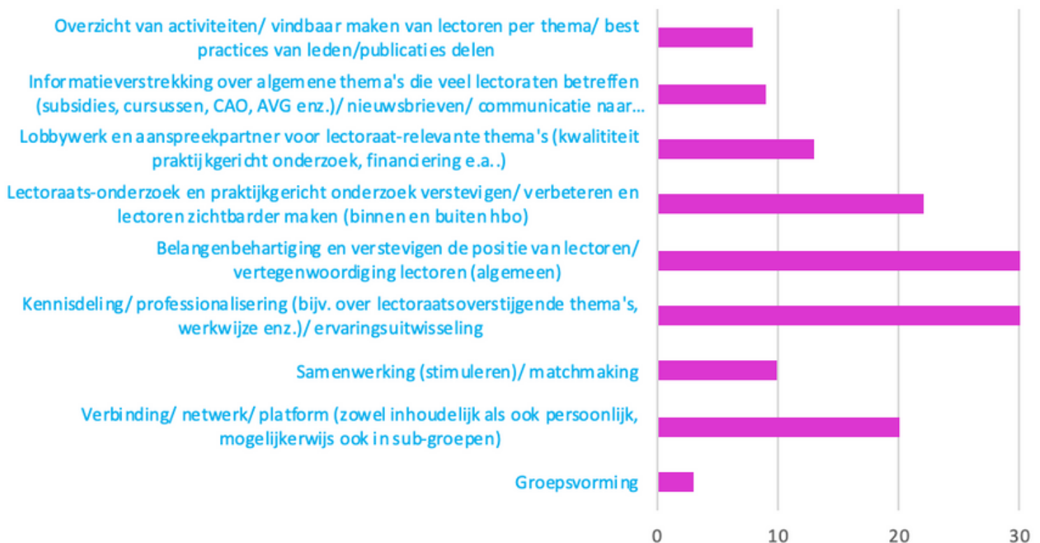
Grafiek 1: Samenvatting resultaten lectoren-survey: wensen en doelstellingen